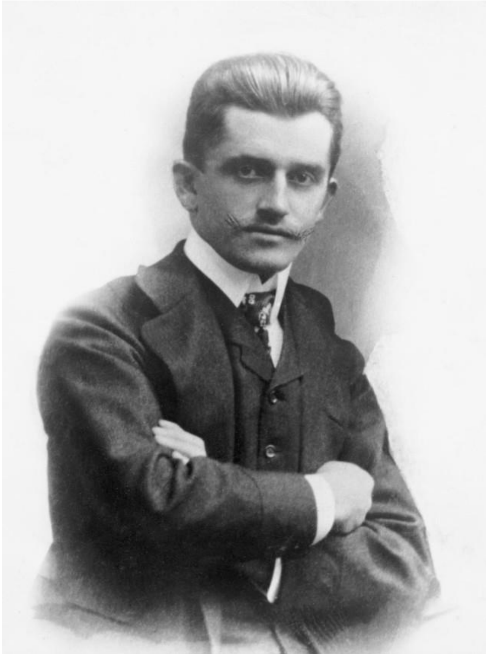
Ferdinand Porsche um 1900

Die untenstehenden Abbildungen stehen für sein Werk und dessen Auswirkungen auf die heutige Automobiltechnik